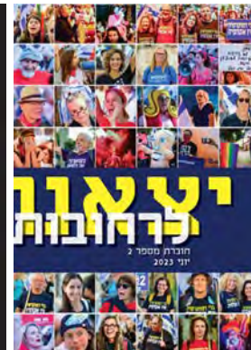
יצאנו לרחובות #2