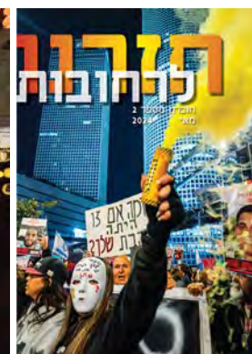
חזרנו לרחובות #2