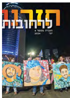
חזרנו לרחובות #4