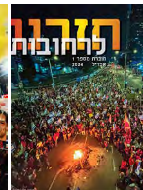
חזרנו לרחובות #1

יתקבלו בברכה חומרים חדשים לחוברות הבאות, נאומים, דעות, שירים, ציורים ותצלומים.