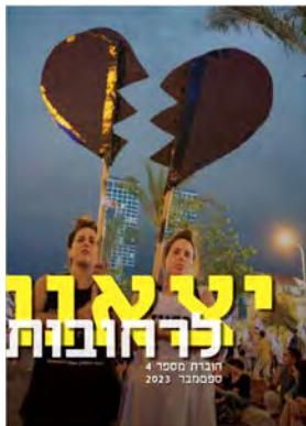
יצאנו לרחובות #4