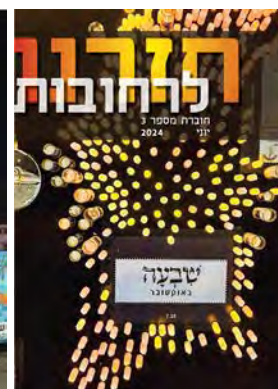
חזרנו לרחובות #3