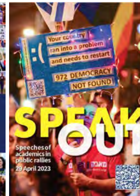
Speak Out #1