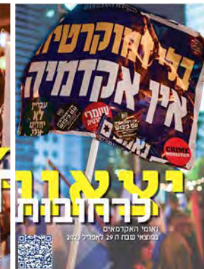
יצאנו לרחובות #1