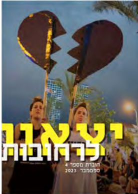
יצאנו לרחובות #4