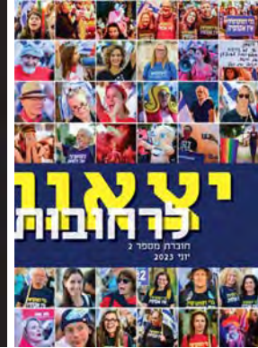
יצאנו לרחובות #2