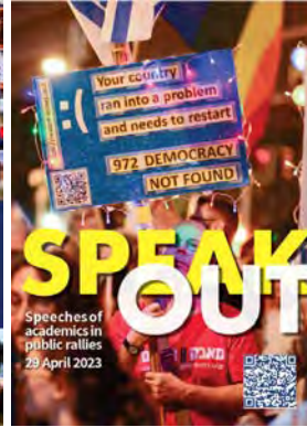
Speak Out #1