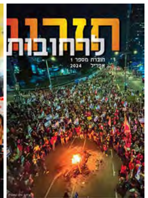
חזרנו לרחובות #1