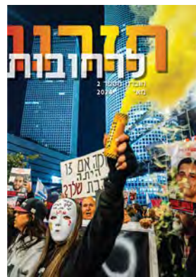
חזרנו לרחובות #2

את כל החוברות ועוד ניתן למצוא גם בקישור זה