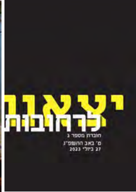
יצאנו לרחובות #3