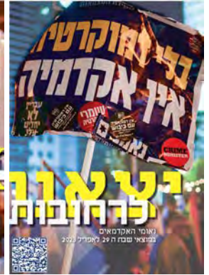
יצאנו לרחובות #1

נשמח לקבל חומרים חדשים לחוברות הבאות, נאומים, דעות, שירים, ציורים ותצלומים דואל למשלוח: matehaacademia@gmail.com