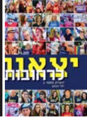
יצאנו לרחובות #2