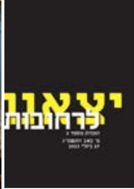
יצאנו לרחובות #3