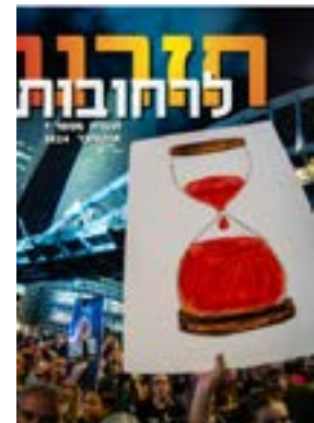
חזרנו לרחובות #7