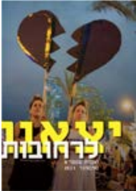
יצאנו לרחובות #4