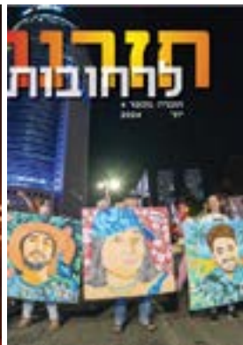
חזרנו לרחובות #4