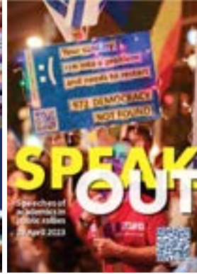
Speak Out #1