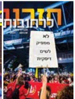
חזרנו לרחובות #6

יתקבלו בברכה חומרים חדשים לחוברות הבאות, נאומים, דעות, שירים, ציורים ותצלומים.