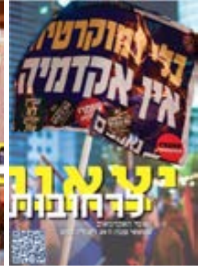
יצאנו לרחובות #1