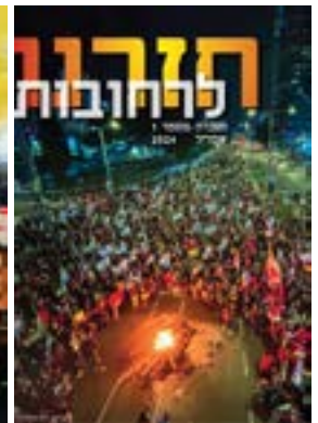
חזרנו לרחובות #1