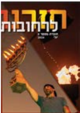
חזרנו לרחובות #5