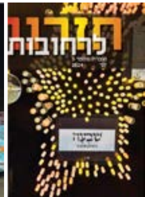
חזרנו לרחובות #3