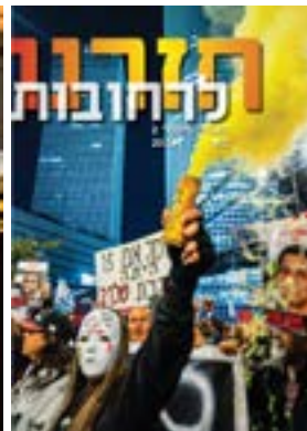
חזרנו לרחובות #2