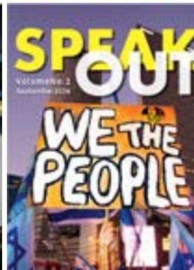
Speak Out #2