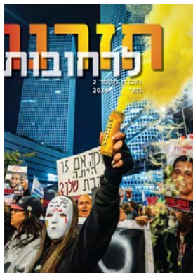
חזרנו לרחובות #2