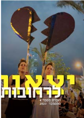
יצאנו לרחובות #4