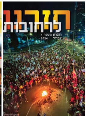
חזרנו לרחובות #1

יתקבלו בברכה חומרים חדשים לחברות הבאות, נאומים, דעות, שירים, ציורים ותצלומים.