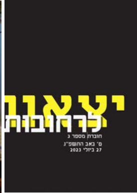
יצאנו לרחובות #3