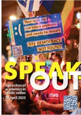
Speak Out #1