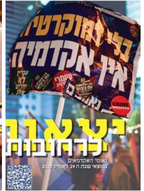
יצאנו לרחובות #1