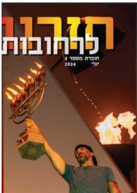
חזרנו לרחובות #5