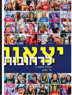
יצאנו לרחובות #2