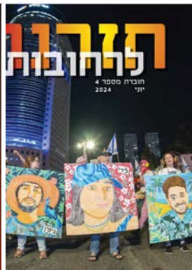
חזרנו לרחובות #4