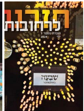
חזרנו לרחובות #3